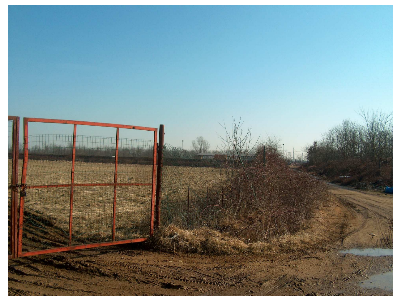
FOTO 2 - TERRENO COMUNALE GRAVATO DI USO CIVICO CATASTO TERRENI FOGLIO 8 PARTICELLA 46