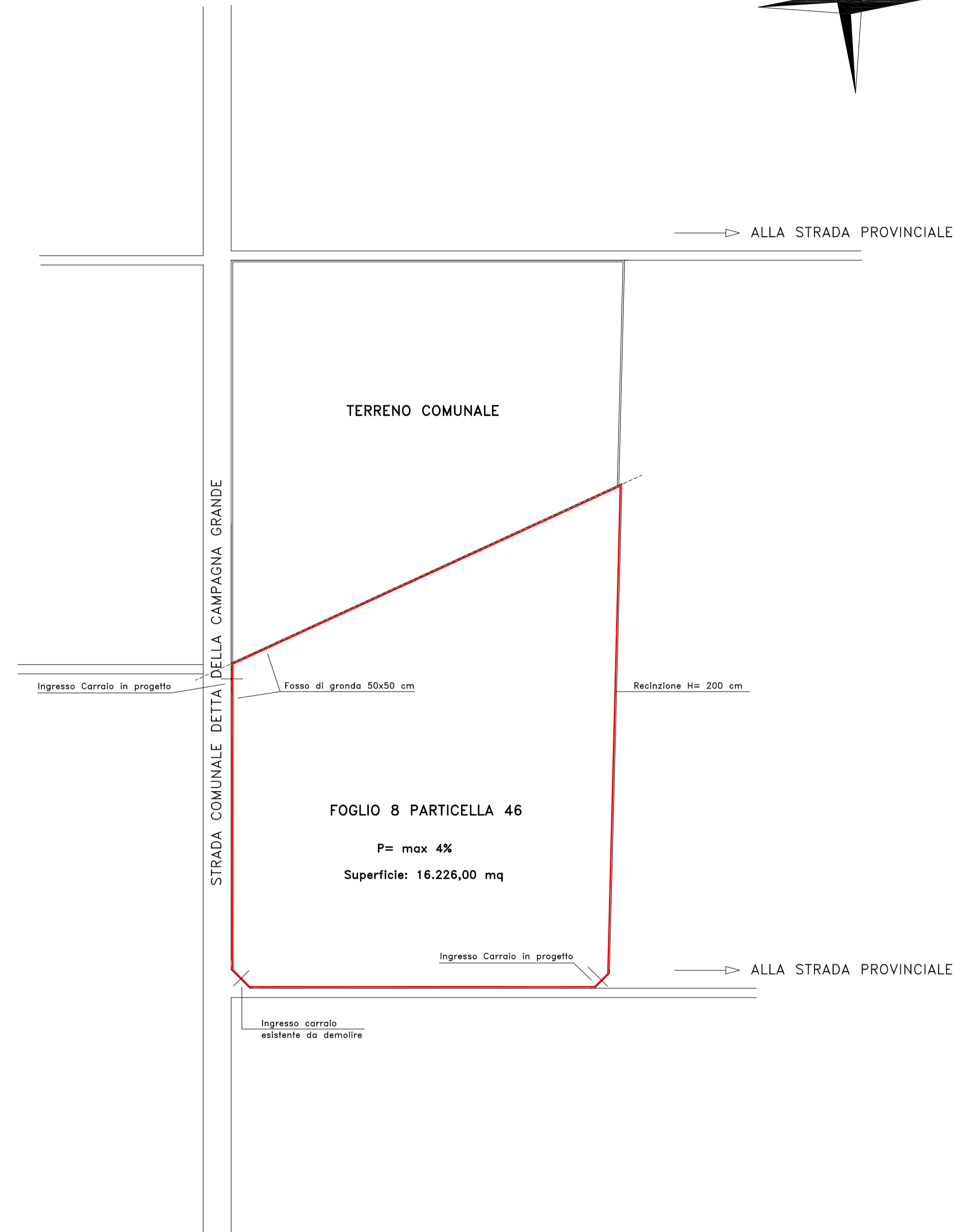
PLANIMETRIA GENERALE SCALA 1:1000 (situazione esistente)