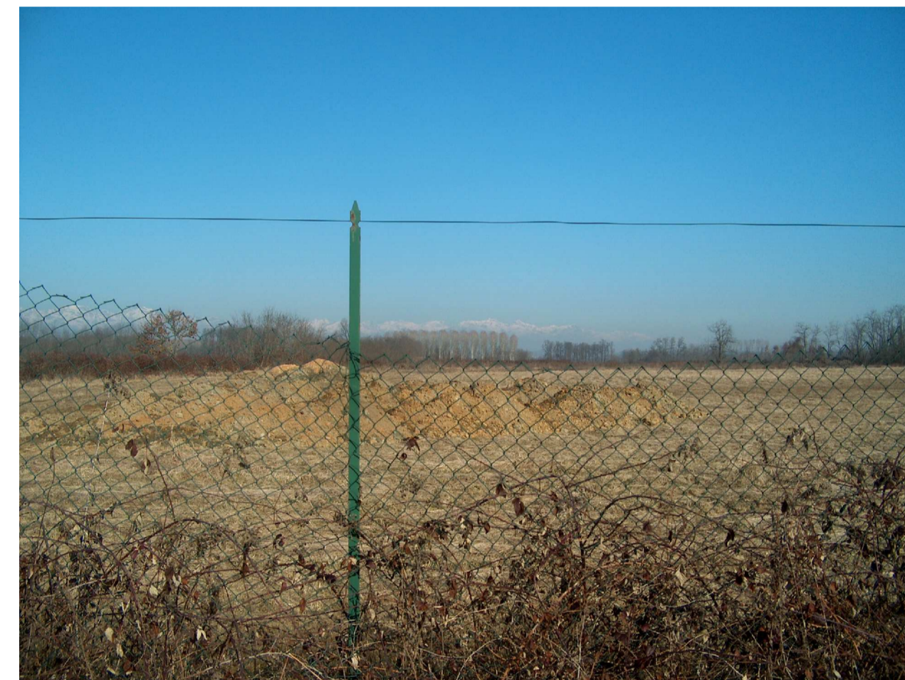
FOTO 1 - TERRENO COMUNALE GRAVATO DI USO CIVICO CATASTO TERRENI FOGLIO 8 PARTICELLA 46